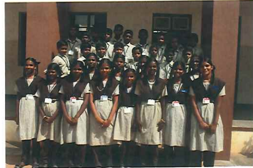
Nach 10 Jahren: Die Schüler besuchen heute die 9. und 10. Klasse

Aus diesem Grund kommen wir nicht umhin, auf dem Gelände unseres PILLAR-Bildungszentrums zwei neue Gebäude zu errichten. Diese werden künftig den Kindergarten beherbergen. Dessen Kinder sind im Moment provisorisch im Gebäude der Näherinnenausbildung untergebracht.