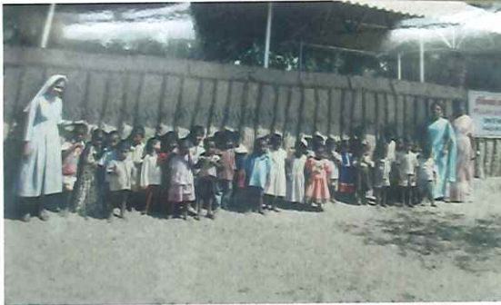
Der Beginn: unser Kindergarten im Jahre 2002